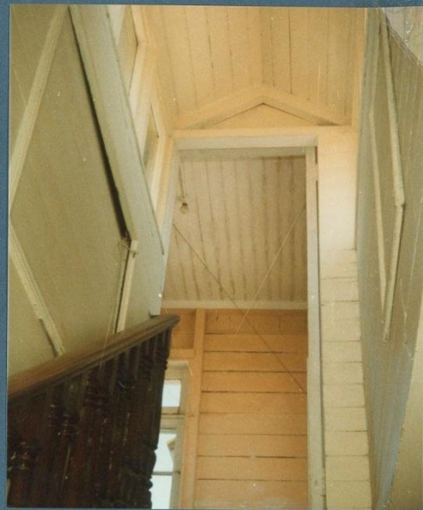
f.nº7 ... el acceso iluminado, hacia el mirador.