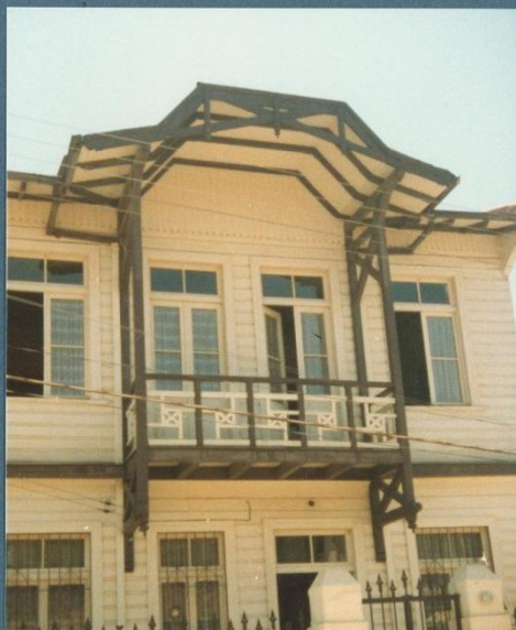
f. nº2 detalle balcon y gablete fachada principal.