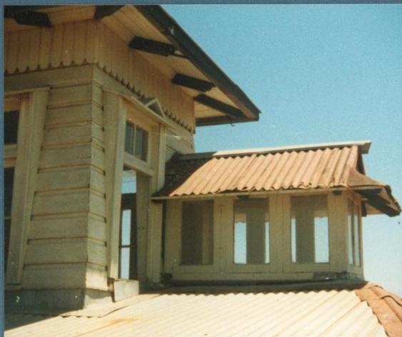
f.nº8 vista exterior mirador y tragaluz de la escalera.