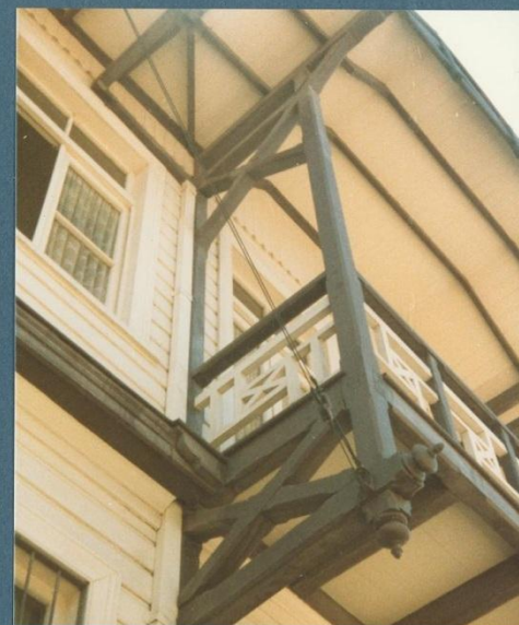
f. nº3 detalle estructura del balcon y gablete.