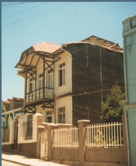
f. nº1 vista general de la vivienda