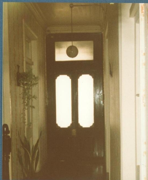
f. n° 4 pasillo longitudinal con acceso principal recibidor.