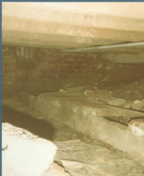
f. n° 9 detalle envidado del piso inferior y canaleta de aguas lucvias.