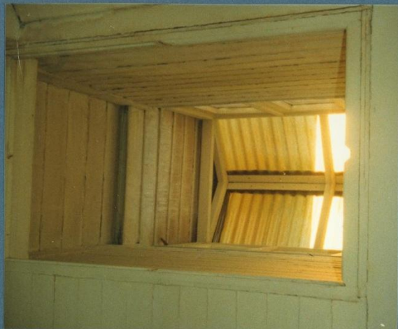
f.nº6 detalle tragaluz del baño