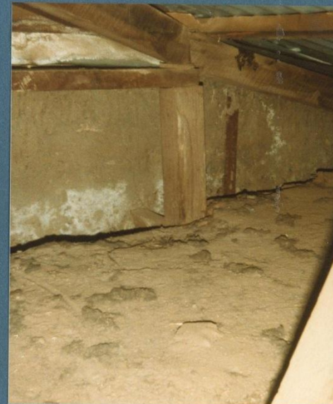
f. n° 10 detalle enbarrado y estructura de la cubierta en relación al muro cortafuzqps.